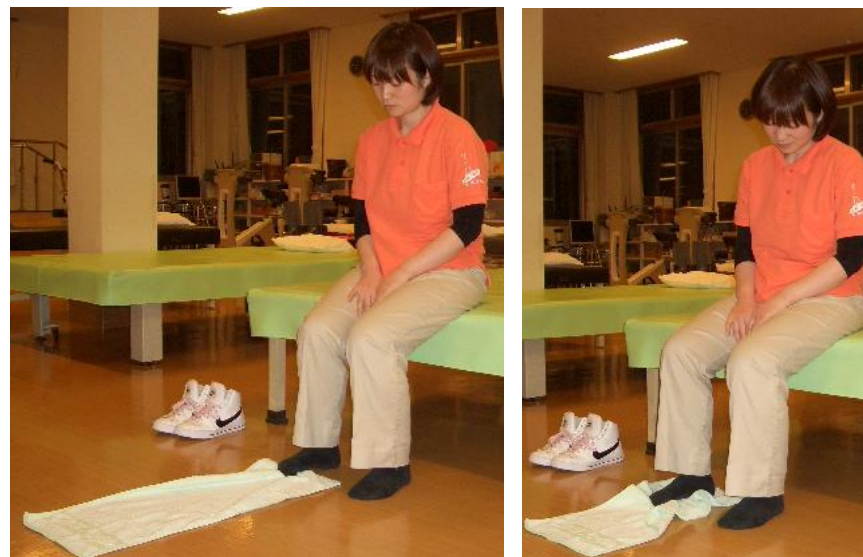
□～血行改善、足のゆびの筋力～