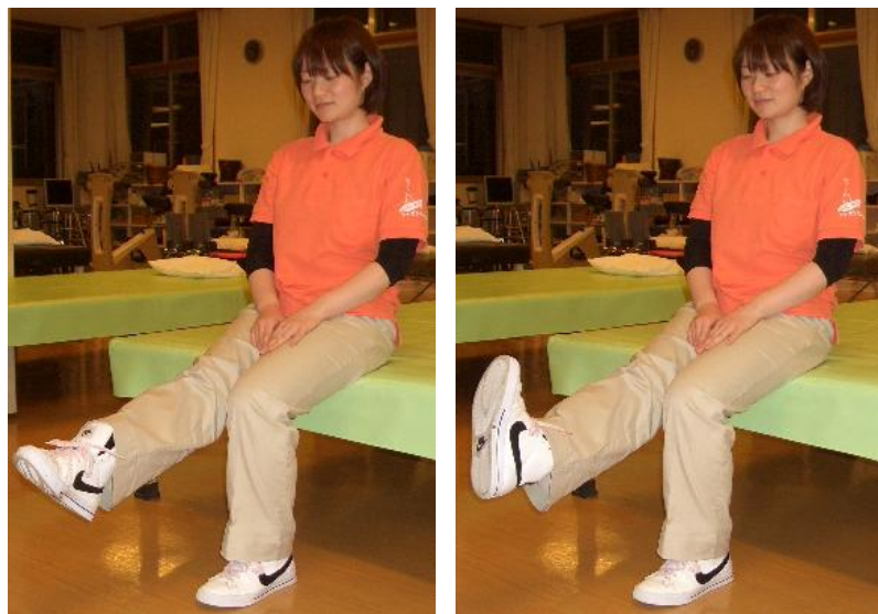
□～血行改善、ふとももの筋力、ひざの痛み～